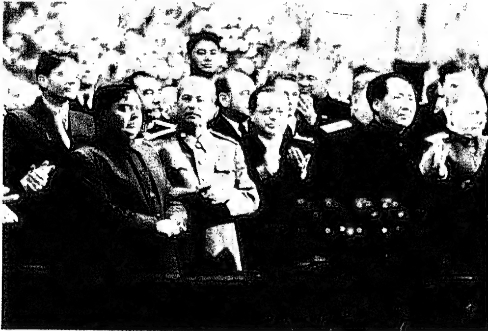
ستالين وماو تسي تونغ، ويبدو مالينكوف إلى يمين ستالين والمارشال فوروشيلوف في أقصى اليسار إلى جانب الزعيم الصيني.